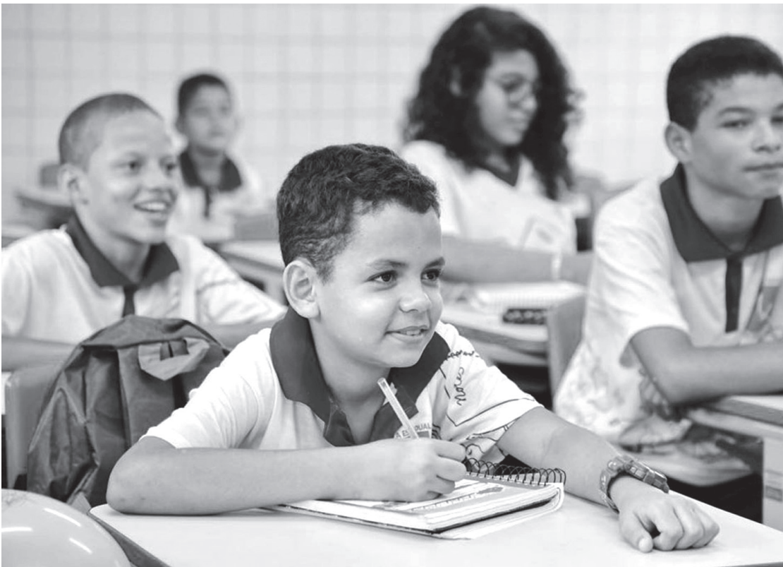
Mais de cem novos alunos se matricularam na Escola Ozória de Moura Lima depois da reforma

Já a Escola Estadual Tabuleiro do Pinto havia passado apenas por duas pequenas pinturas no período de 1956 a 2017. A unidade só dispunha de dois banhei-