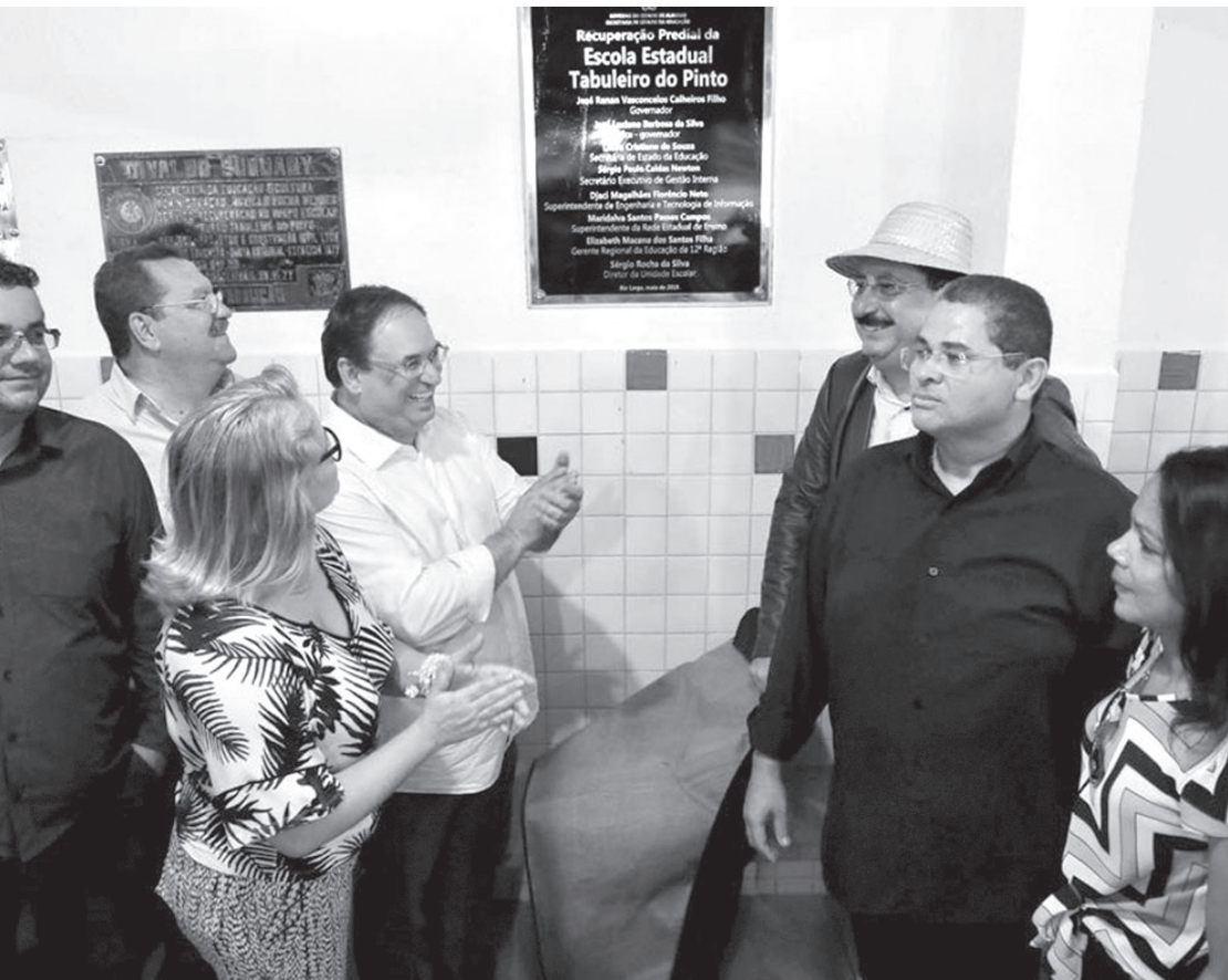
Vice-governador Luciano Barbosa e secretária da Educação Laura Souza entregam escolas reformadas

O Governo de Alagoas já reformou 164 unidades de ensino em todo o Estado e, até o fim de 2018, outras 50 escolas devem ser recuperadas.