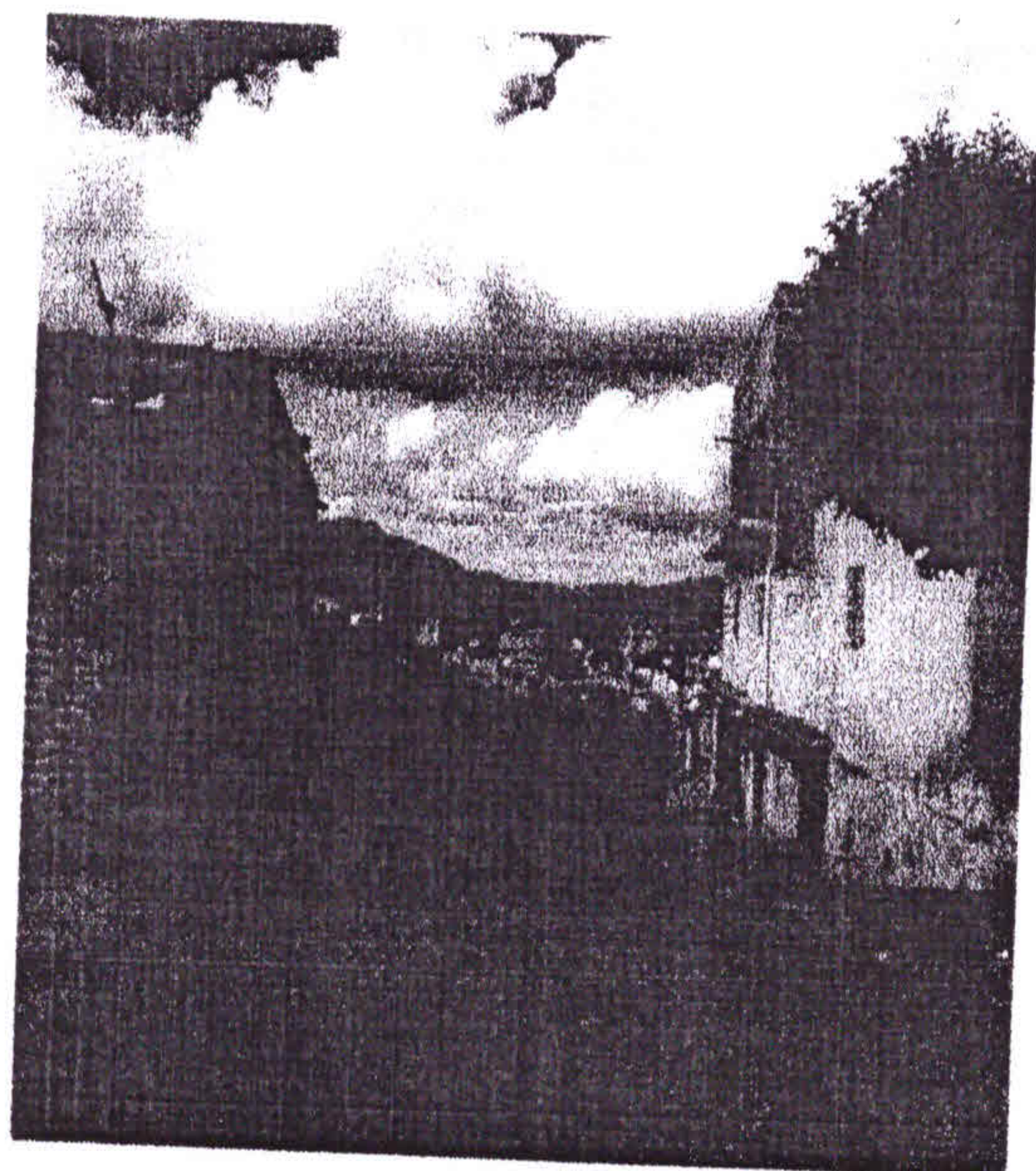
Início da rua